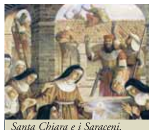
Santa Chiara e i Saraceni . Pittura su tavola di Piero Casentini. Monastero Santa Croce, Pignataro Maggiore