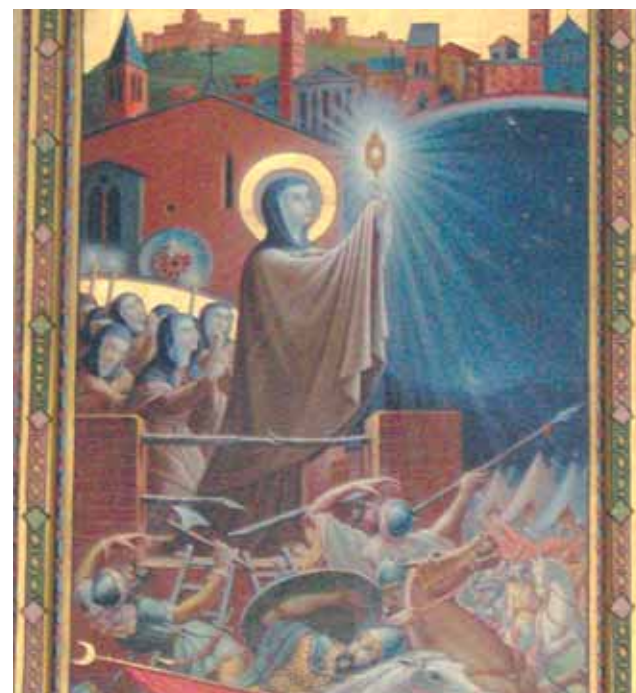
Icona presente nella Basilica di Santa Chiara, Assisi. La fede di Chiara nel Figlio di Dio e di Maria, nascosto nella povertà del Pane Eucaristico, ha annientato la forza dei nemici

Questo Miracolo Eucaristico è citato nella Leggenda di Santa Chiara Vergine , scritta da Tommaso da Celano e descrive il Miracolo operato da Santa Chiara d'Assisi che con il Santissimo Sacramento riesce a respingere le truppe saracene al soldo dell'imperatore Federico II di Svevia.