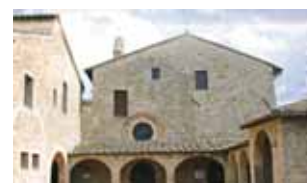
Convento di San Damiano in Assisi