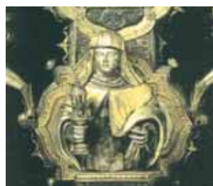
Santa Chiara . Particolare della grande Croce di Gianfrancesco dalle Croci.