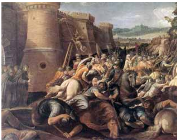
Santa Chiara e l'assedio di Assisi , Giuseppe Cesari (1568-1640). Museo Hermitage, San Pietroburgo

Nella Leggenda di Santa Chiara Vergine si raccontano vari miracoli operati da Santa Chiara. Si narrano episodi di moltiplicazione di pane, di bottiglie di olio comparse quando in convento era del tutto assente. Ma il più famoso tra i miracoli da lei operati è quello accaduto nel 1240, un venerdì di settembre, in cui Chiara di fronte ad un assalto di soldati saraceni penetrati con la forza anche nel chiostro del suo convento di S. Damiano, riesce a metterli in fuga mostrando loro l'Ostia Santa.