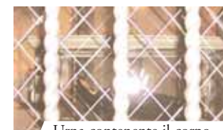
Urna contenente il corpo di Santa Chiara, Assisi