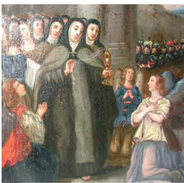
Antica raffigurazione del Miracolo di Santa Chiara