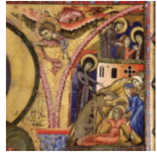
I parenti cercano di portare via Agnese dal monastero di Panzo.