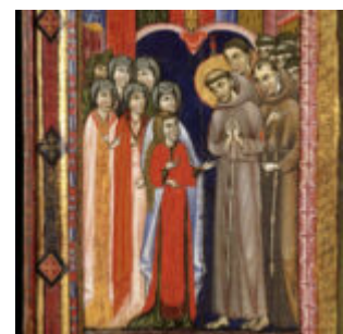
Santa Chiara è accolta da san Francesco alla Porziuncola.