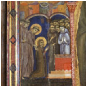
San Francesco taglia i capelli alla Santa.