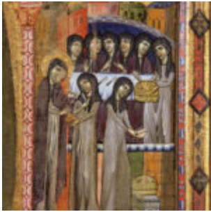
Miracolo dei pani.