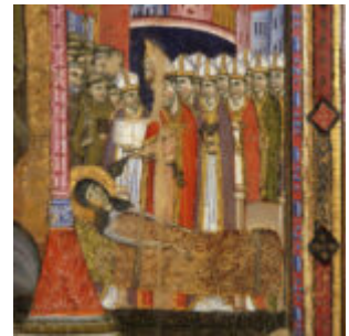
Funerali di santa Chiara.