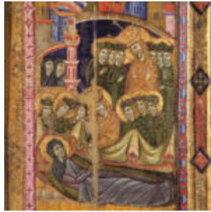
Apparizione della Vergine a santa Chiara.