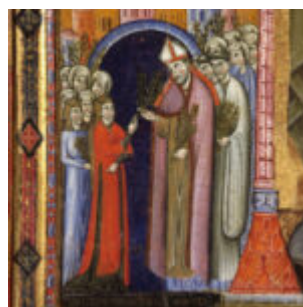
Santa Chiara riceve la palma dal vescovo Guido.